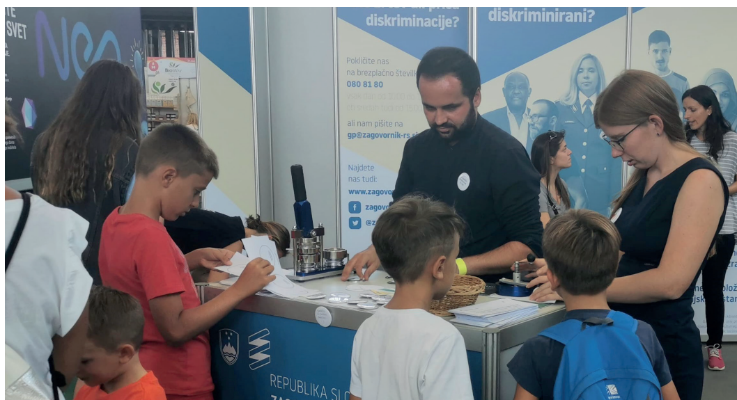
Na Otroškem Bazarju so se strokovni sodelavci Zagovornika načela enakosti z otroki in njihovimi starši pogovarjali o diskriminaciji in izdelovali priponke s sporočili na temo enakosti.

Z namenom spremljanja trendov in novosti glede stanja človekovih pravic v gospodarstvu se je Zagovornik od 2. septembra do 3. septembra 2019 udeležil tudi Blejskega strateškega foruma z naslovom Viri (ne)stabilnosti (ang. (Re)sources of (in)stability).